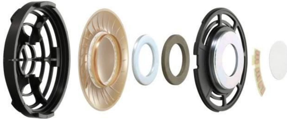
MDR-Z1000 推動單元橫切面 (左至右): 外殼, 振膜, 導磁環, 磁圈推動器外殼, 電極, 隔音組件

MDR-Z1000 專為滿足專業製作環境對功能與表現的嚴謹要求而研發。該耳筒所配備的液晶高分子振膜使高度精確與逼真的音頻效果得以在錄音室環境中實現。這種新研發的物料在高度堅固（在寬廣頻寬上精確地將輸入訊號轉換為聲音的關鍵）與高度內損（用於抑制不必要的振膜震動）之間取得平衡；所產生的自然清脆聲音表現和出色的 5-80kHz 頻率響應範圍、24Ohm 低阻抗和 108dB/mW 高靈敏度（此為要求最佳聲音工具之音響發燒友及音樂專業人士的重要考慮因素），都令 MDR-Z1000 的用戶讚嘆不已。