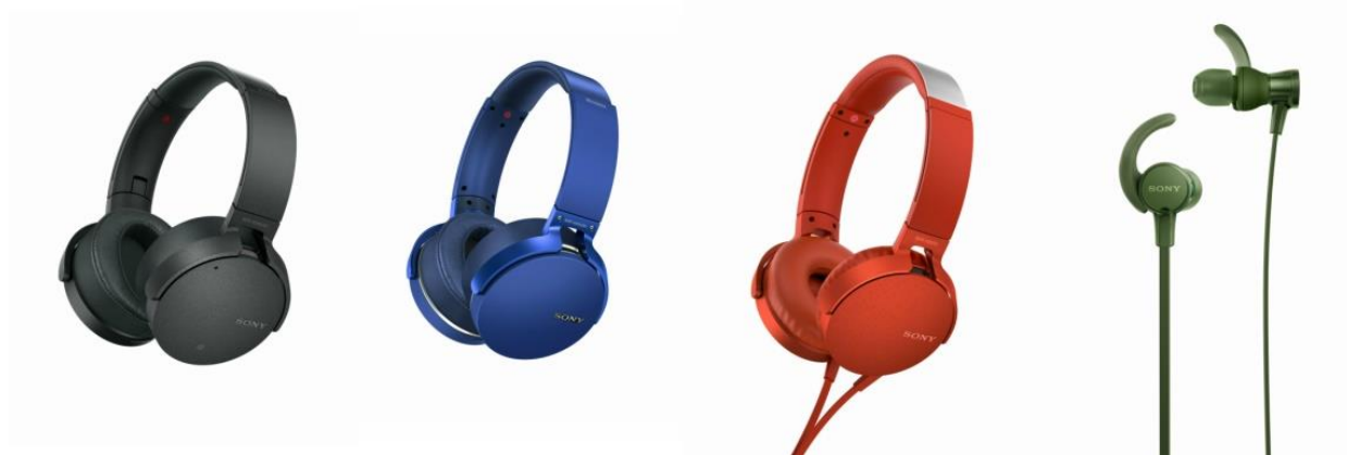
由左至右：MDR-XB950N1、MDR-XB950B1、MDR-XB550AP 及 MDR-XB510AS

香港・2017年3月6日 – Sony 今日進一步增強 EXTRA BASS™ 耳機系列，以提升聆聽現今流行音樂的體驗。EXTRA BASS™ 系列的 4 款新成員包括配備降噪技術的無線耳機 MDR-XB950N1、無線耳機 MDR-XB950B1、備有多種顏色選擇的耳機 MDR-XB550AP 及防水運動型入耳式耳機 MDR-XB510AS。全新陣容讓用戶無論身處任何環境，均可舒適地享受具有強勁重低音聲效的優質音樂。