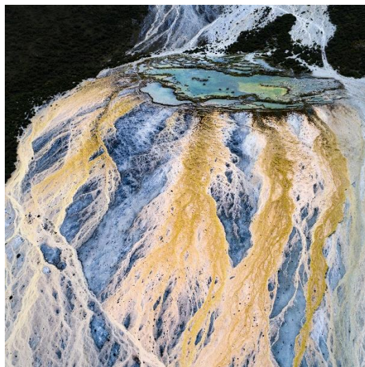
香港特別行政區, 公開賽, 風景與自然組別

公開賽涵蓋 10 個類別並以最佳單幅相片為評選標準。「索尼世界攝影大獎」的評判讚揚公開組賽的 4 名香港攝影師，並將他們的作品列為其參賽類別的前 50 名佳作。