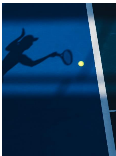
© Lampon Yip (加拿大籍，居於香港特別行政區), 公開賽, 動作組別