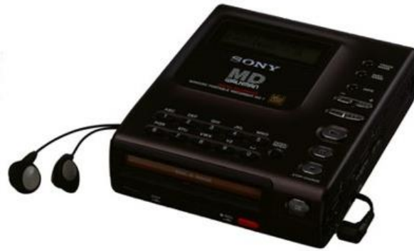
MZ-1 MiniDisc Walkman®

Sony 的另一個突破是於 1984 年推出全球首部便攜式 CD 播放機 D-50。該 CD 播放器的體積相等於四個 CD 盒疊合一起，當時有助於加速 CD 的普及化，而且價格合理。此後，Sony 將設計工藝更臻完美，於 1992 年推出了全球第一款 MiniDisc Walkman® MZ-1，糅合錄音、播放、數字鍵盤和防跳播技術於一身。