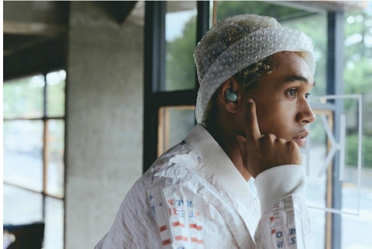
Wide Area Tap 功能