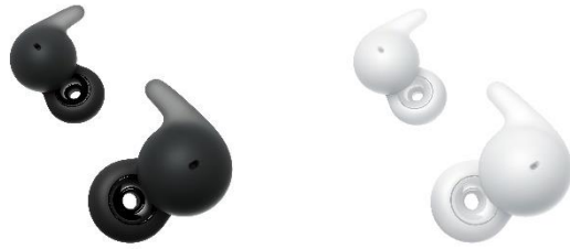
LinkBuds Open 備有黑色及白色