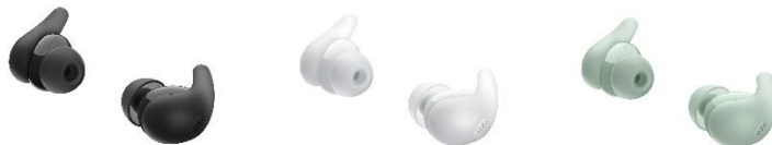
LinkBuds Fit 提供黑色、白色及薄荷綠色