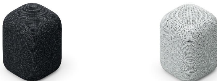
LinkBuds 揚聲器備有黑色及淺灰色