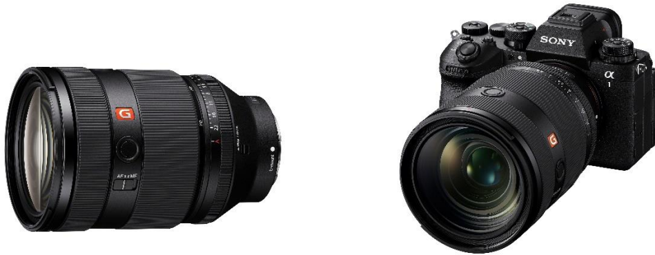
FE 28-70mm F2 G Master (SEL2870GM)

為創作者打造終極全片幅 E-mount 鏡頭，擁有高解像度、優美散景和先進自動對焦功能